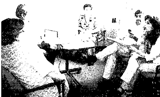
Reunión Nueva política de educación.