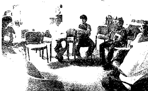
Reunión P.U. Católica Proyecto BID.