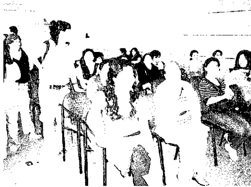
Reuniones coordinación con Microempresarias