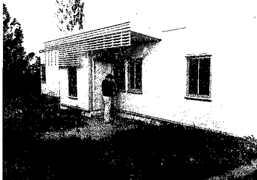
Visita Proyecto casa Térmica en Villarrica (PUC Villarrica).