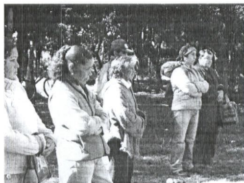
PRIMER CAMPEONATO DE PALIN PUCON 2010, SECTOR HUIFE