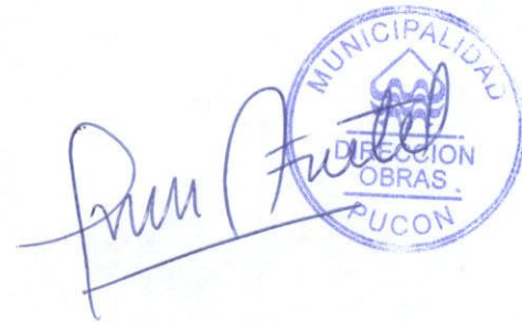
RUBEN BASCUR BADILLA DIBUJANTE