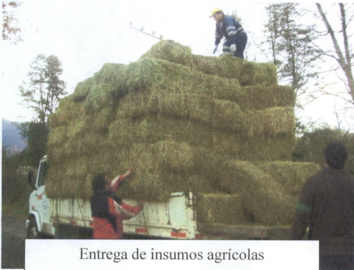
Entrega de insumos agrícolas