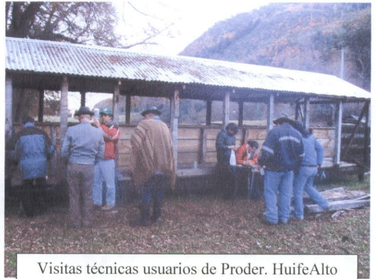
Visitas técnicas usuarios de Proder. HuifeAlto 18-06-2010