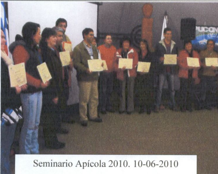
Seminario Apícola 2010. 10-06-2010