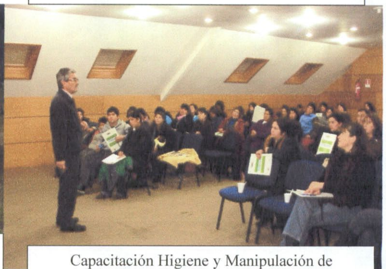
Capacitación Higiene y Manipulación de Alimentos. 22 y 24 junio 2010