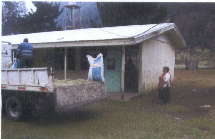
Entrega de insumos agrícolas Río Blanco. 04-06-2010