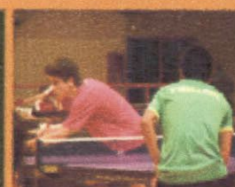
TENIS DE MESA