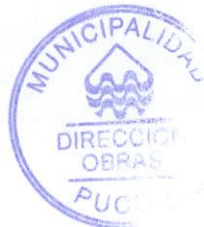
RUBEN BASCUR BADILLA DIBUJANTE