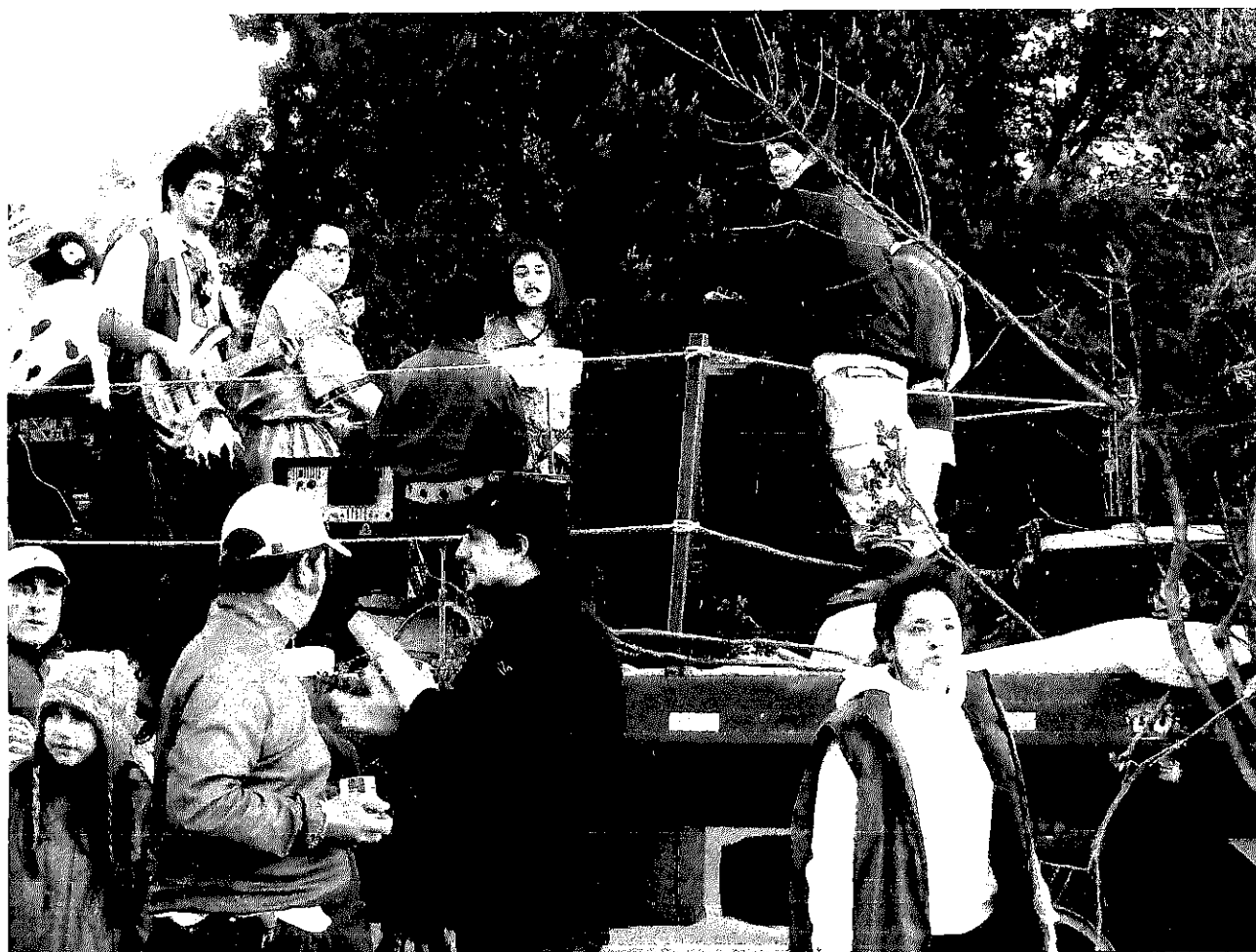
Festival de la Nieve – 12 a 15 de agosto