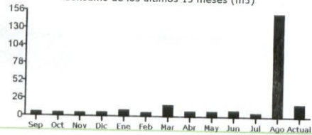
Consumo de los últimos 13 meses (m3)

Timbre Electrónico SII Res. 74 del 2005. - Verifique Documento: www.sii.cl