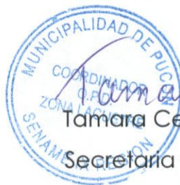
Tamara Cepeda Lagos