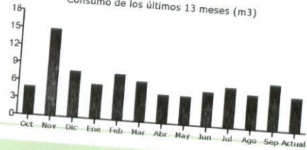
Consumo de los últimos 13 meses (m3)

Timbre Electrónico SII Res. 74 del 2005. - Verifique Documento: www.sii.cl