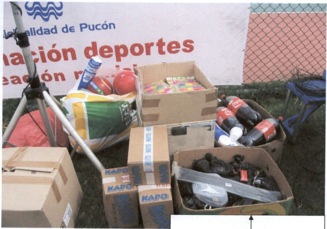
Amarras plásticas ↑