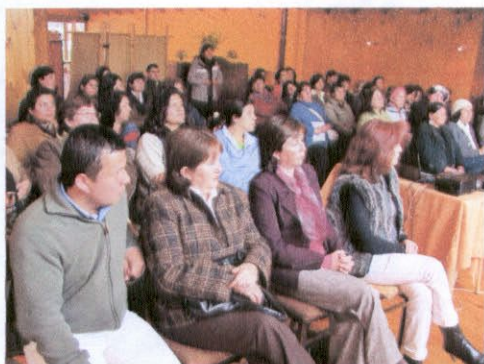
Lanzamiento Concurso Mujer 2.0 comienza a emprender