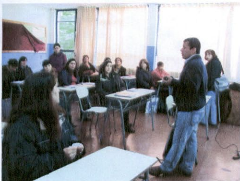
Capacitación módulos habilidades emprendedoras