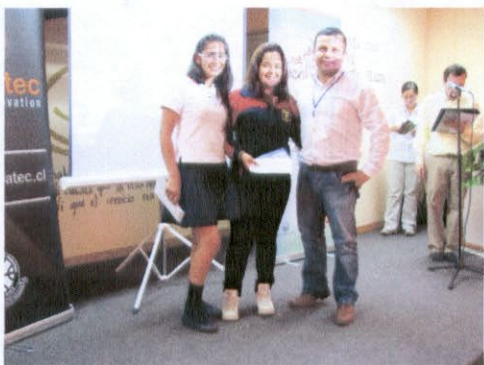
Premiación Concurso Colegios

Se extiende el presente informe para ser presentado a la dirección de administración y finanzas para su posterior cancelación.