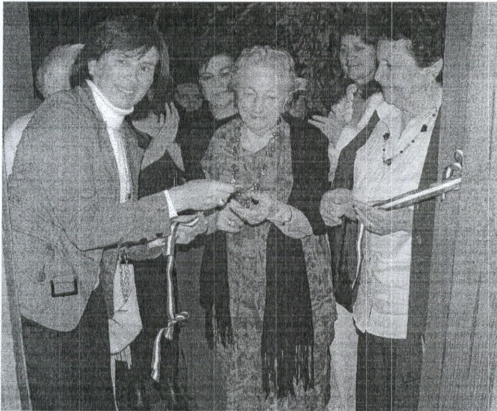
FOTOGRAFÍA DE EXPOSICIÓN DE ANTIGUEDADES CLUB DE ADULTO MAYOR LA AMISTAD. MARTES 16 DE FEBRERO 2010.-