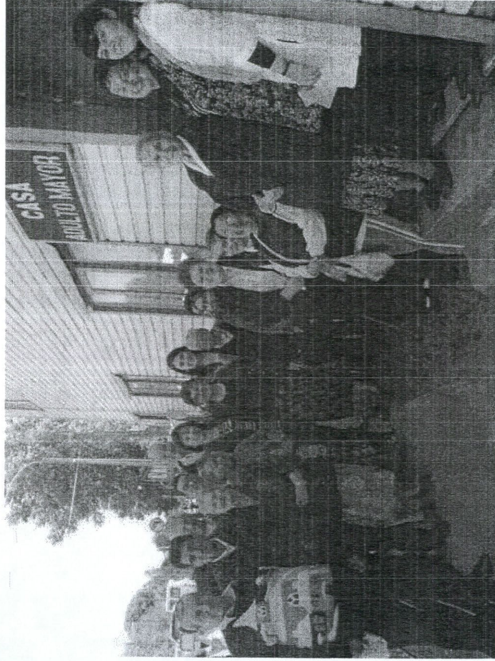
FOTOGRAFÍA DE LANZAMIENTO PROGRAMA DEL ADULTO MAYOR