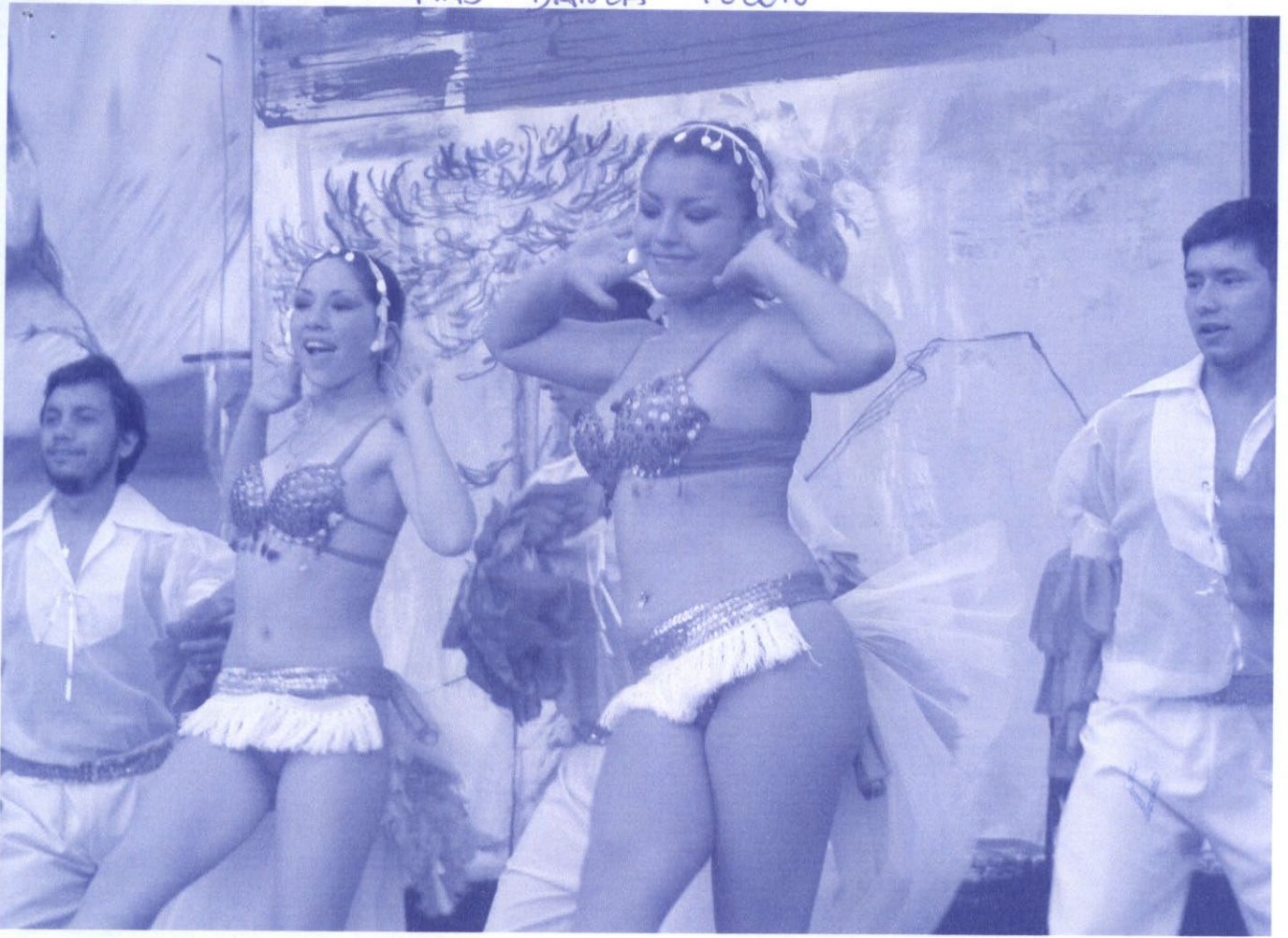
MAS DANZA PULON