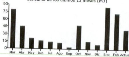
Consumo de los últimos 13 meses (m3)